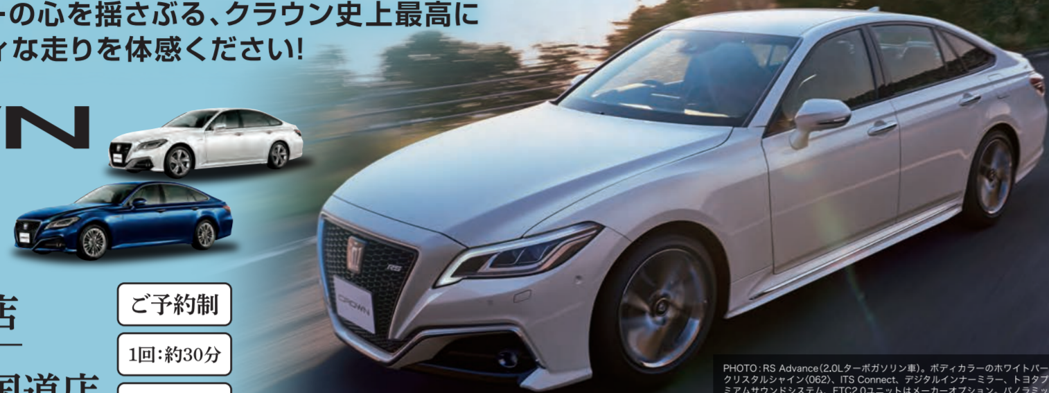
PHOTO: RS Advance(2.0Lターボガソリン車)、ボディカラーのホワイトパールクリスタルシャイン(082)、ITS Connect、デジタルインテリジェント、トヨタプレミアムサウンドシステム、ETC2.0ユニットはメーカーオプション、パナソニックミュージック&インテリジェントパーキングアシスト2とパーキングサポートブレーキ(後部車線)はメーカーオプション、リヤカメラアイクォンシタはメーカーオプション、レザーシートパッケージはメーカーオプション、■写真は合成です。