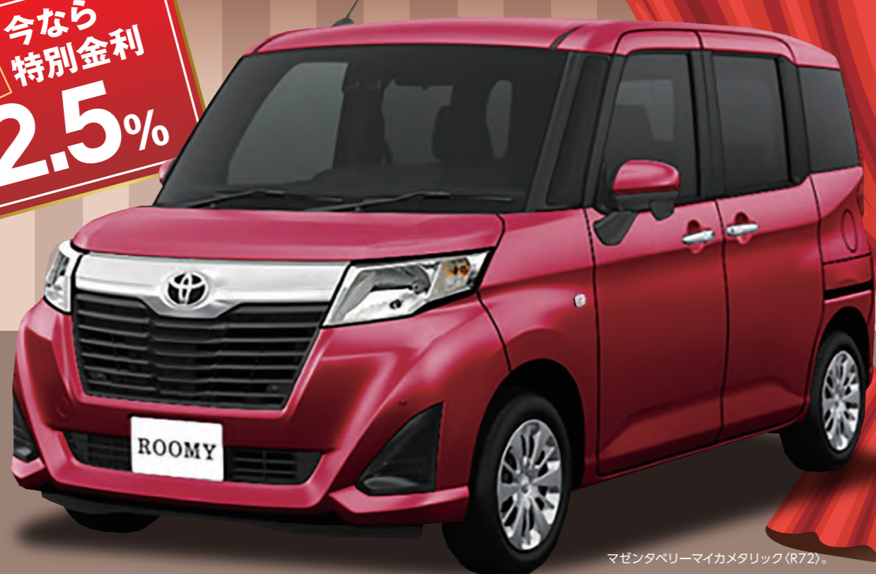
マゼンタベリマイカメタリック(R72)

特別販売価格 1,713,915円 (税込) 194,111円 (税込) お買い得! 車両本体価格(税込) 1,701,000円 + オプション合計(税込) 207,026円 = 合計価格(税込) 1,908,026円