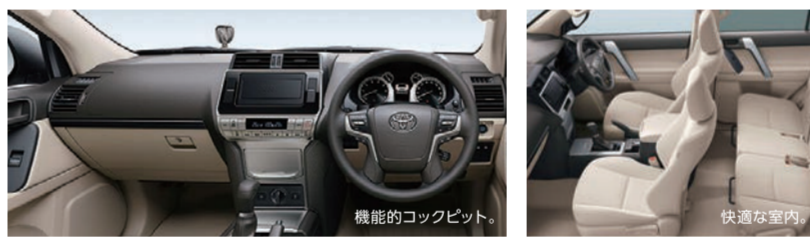
機能的コックピット。