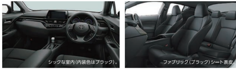
シックな室内(内装色はブラック)。