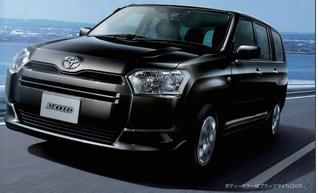
ボディカラーはブラックマイカ(209)。